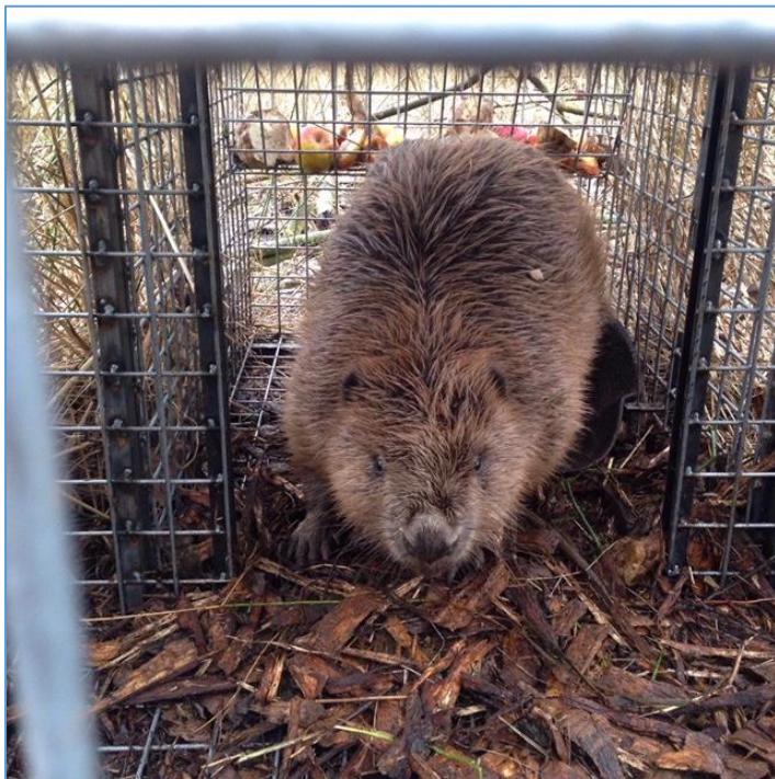
Afbeelding 3.1: Bever in levend vangende kooi